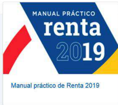
Manual práctico de Renta 2019