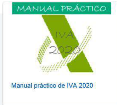
Manual práctico de IVA 2020