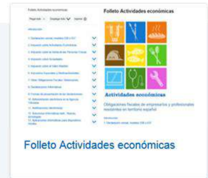
Folleto Actividades económicas