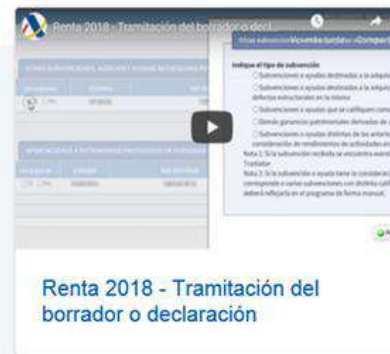
Renta 2018 - Tramitación del borrador o declaración